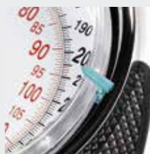
4 indicatori segnapeso