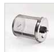
Cestello rotante inox