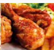
COSCE DI POLLO 190°C 30 min.