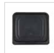
Vassoio antiaderente con funzione raccogli grassi