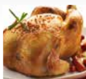
POLLO ARROSTO 180°C 45 min