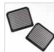
2 Vassoi forati antiaderenti per cottura su più livelli