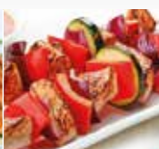
CARNE E SPIEDINI 185°C 20 min.