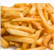
PATATINE 200°C 20 min.