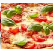
PIZZA 180°C 20 min.