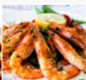
PESCE E CROSTACEI 180°C 15 min.