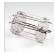
Accessorio rotante inox per spiedini