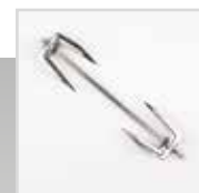
Accessorio girarrosto rotante inox