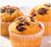
DOLCI 160°C 35 min.