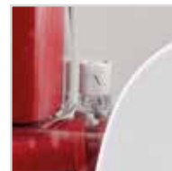
Tasto espulsione rullo Roll locking button