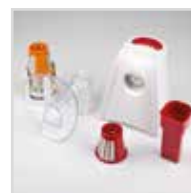
Facile da pulire Easy to clean