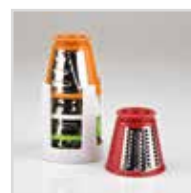
Accessorio porta rulli Rolls container