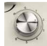
6 velocità + PULSE