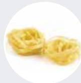
TAGLIATELLE / FETTUCCINE MAKER Struttura in acciaio inox, dimensione rullo 14cm