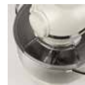
Contenitore in acciaio inox Coperchio con apertura