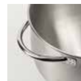
Contenitore con maniglia