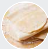
TIRAPASTA / PASTA MAKER Struttura in acciaio inox, 9 regolazioni di spessore, dimensione rullo 14cm