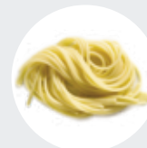
SPAGHETTI / SPAGHETTI MAKER Struttura in acciaio inox, dimensione rullo 14cm