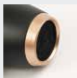
Filtro aria posteriore removibile