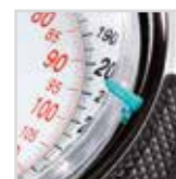
4 indicatori segnapeso 4 indicators