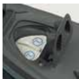
Filtro anti calcare intercambiabile

EFFICIENT AND CONVENIENT: UNLIMITED IRONING CAPACITY WITH STATION'S INNOVATIVE CONTINUOUS REFILL SYSTEM!