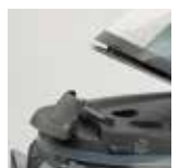
Sistema di blocco ferro