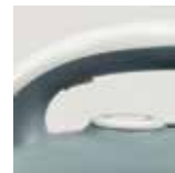
Tasto emissione vapore