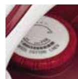
Regolazione della temperatura