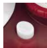
Sistema di auto-pulizia