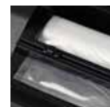
Vano porta-rullo e taglierino integrati